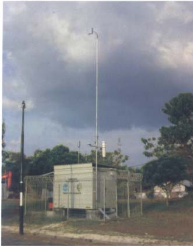
Gambar 1 : Stasiun Pemantau Kualitas Udara Ambien Secara Otomatis