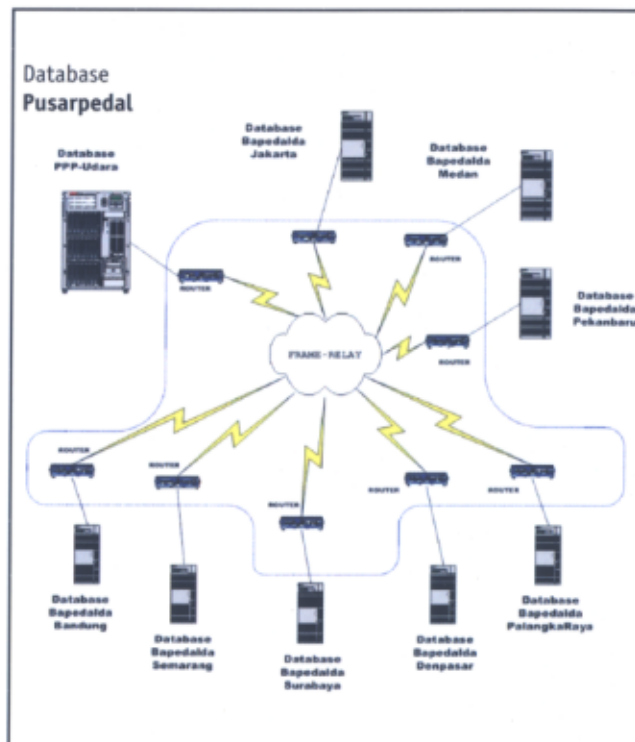
Gambar 4 : Database system AQMS

Semua data yang dihasilkan dari stasiun pengukuran pada 10 (sepuluh) kota databasenya dikumpulkan dimasing-masing daerah dan di Main Center (MC) di Jakarta.